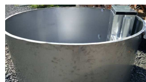
Nerez vložka k zabudování