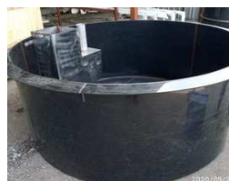
Plastová vložka k zabudování