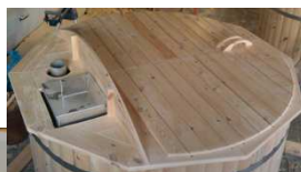
Dřevěný kryt Kryt kamen