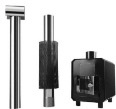
Externí kamna typ I napojení pomocí samotiže, pomalejší vytápění