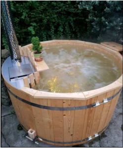
Krytu komínu děrovaný plech