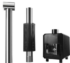
Externí kamna typ I napojení pomocí samotíže, pomalejší vytápění