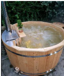
Krytu komínu děrovaný plech